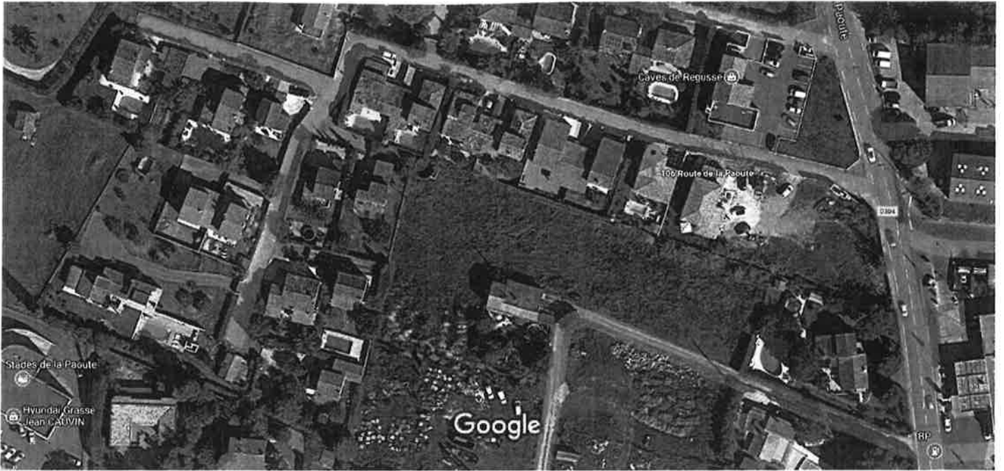
20 m