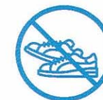
J'évite les efforts physiques