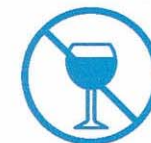
Je ne bois pas d'alcool