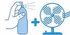
Je mouille mon corps et je me ventile