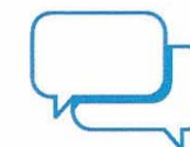
Je donne et je prends des nouvelles de mes proches