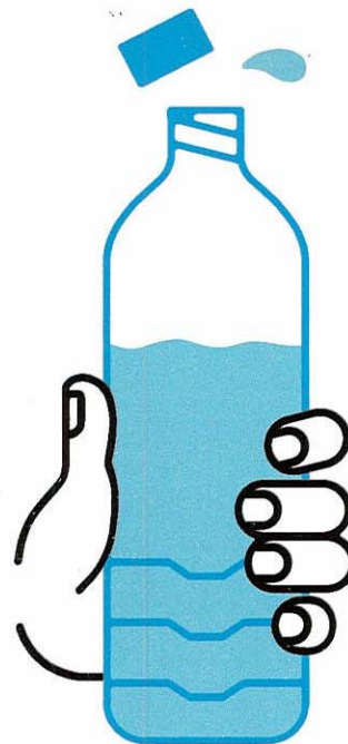
JE BOIS RÉGULIÈREMENT DE L'EAU