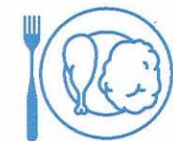
Je mange en quantité suffisante