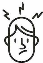
Maux de tête