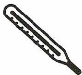
Fièvre > 38°C